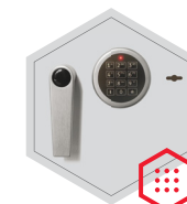
Elektronisches Schloss kombiniert mit mechanischer Revision