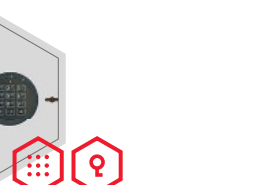
Elektronischschloss kombiniert mit mechanischer Revision