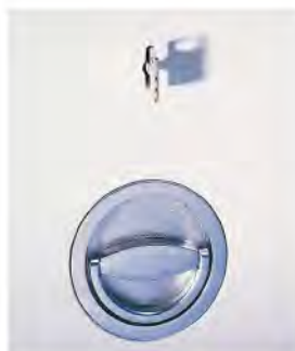
DSS mit Ochsenring.