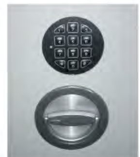
Elektron. Zahlenkombinationsschloss La Gard Basic / versenkt.