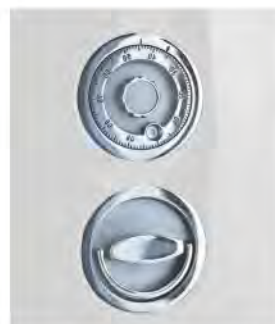
ZKS mit Ochsenring.