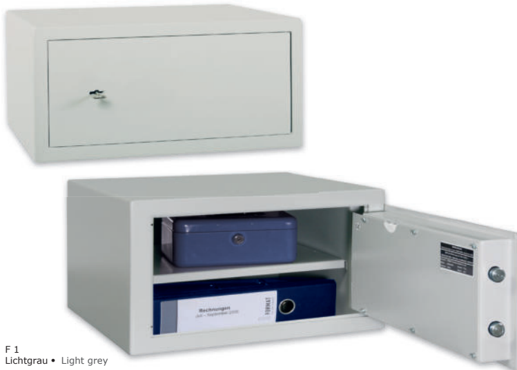
F 1 Lichtgrau • Light grey

Möbeleinsatztresor, Stufe A (VDMA 24 992, Ausgabe Mai 1995)* Furniture safe, Level A (VDMA 24 992, May 1995 edition)*