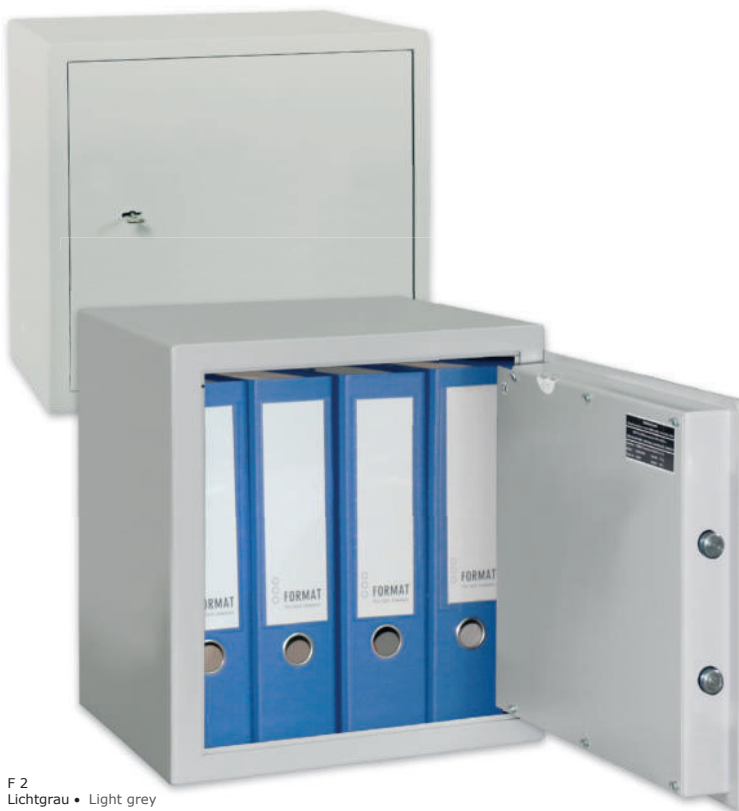
F 2 Lichtgrau • Light grey

Dekoration nicht im Lieferumfang enthalten • decoration not included in the delivery